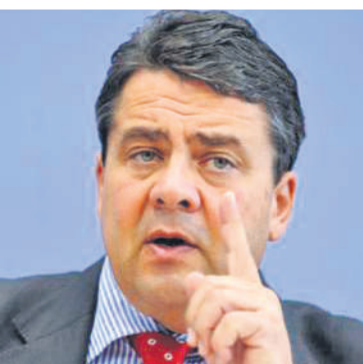
Sigmar Gabriel

„Wir werden von Praktikanten regiert, die nur ein Thema kennen: ihr Klientel mit Steuergeschenken zu bedienen.“